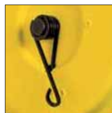
Ajuste de la tensión del muelle modelo YFS-03/04/05 con eje central y palanca para el muelle