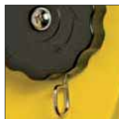
Ajuste de la tensión del muelle modelo YFS-01/02 con rueda de mando central y palanca para el muelle

Herramientas neumáticas, herramientas de montaje, pistolas de pintura, remachadoras, atornilladores, pulidoras etc.